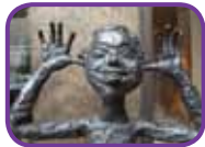
Girl making a face