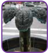
Det droppande trädet