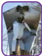
Ikaros och draken