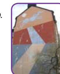
Månens förmåga att skilja land från vatten

28 Månens förmåga att skilja land från vatten är en väggmålning målad av målarkollektivet Sapphos döttrar (1984). Den sitter på huset på Bohusgatan mitt emot Folksamhuset (Bohusgatan 14).