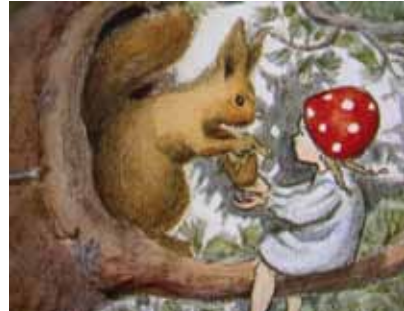
Illustration ur Tomtebobarnen (1910) Copyright ElsaBeskow

1958 instiftades Elsa Beskow-plaketten. Totalt gav Elsa Beskow ut ett 40-tal böcker, som översattes till 14 språk. Tillsammans med Selma Lagerlöf var hon på sin tid den mest översatta svenska författaren.