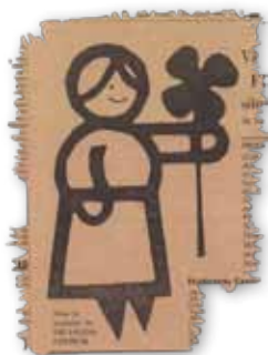
Urklipp DN, 1 oktober 1961.

En neonskylt av en fyllig kvinna på Centrumhuset är symbolen för Fruängen. Efter invigningen den 1 oktober 1961 beskrevs hon i Dagens Nyheter som "en bastant kvinna, stadigt hållande en lyckoklöver i handen" (DN 19611002). Förutom som neonskylt fanns hon på den flagga som hissades.