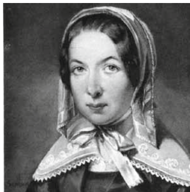
Fredrika Bremer målad av Johan Gustaf Sandberg 1843. Då hade hon blivit myndig efter kungligt beslut.

FREDRIKA BREMER, världsberömd författare, kvinno- rörelsens pionjär i Sverige