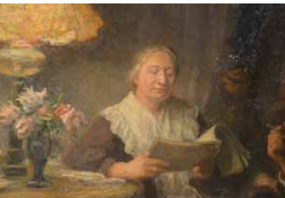
Ellen Key centralgestalt i Hanna Paulis målning Vännerna jfr s. 43

ELLEN KEY, världsberömd författare, tänkare