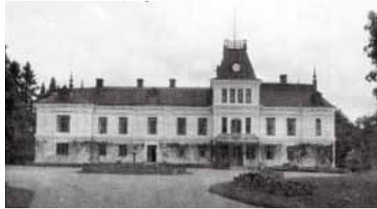
”Stora huset” på Fogelstad på 1920-talet.

Elisabeth Tamm skötte godset själv till de andra godsägarnas förskräckelse. Driften utgick från ekologiska tankar. Hon föredrog hästar framför traktorer och avstod från konstgödsel. Hennes synsätt kom fram i den bok hon skrev tillsammans med Elin Wägner Fred med jorden (1940).