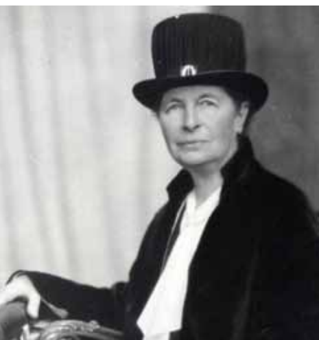
1933 blev Karolina Widerström medicine hedersdoktor vid Karolinska Institutet.

KAROLINA WIDERSTRÖM, Sveriges första kvinnliga läkare, hedersdoktor i medicin, hälso- och sexualupplysare, organisatör av kvinnliga nätverk