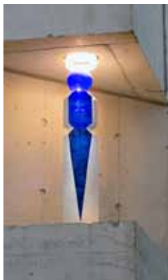
Skulpturen rakt framifrån.