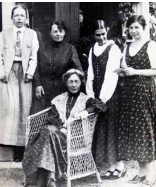
De fem som grundade Fogelstadkretsen. Stående från vänster Elisabeth Tamm, Ada Nilsson, Honorine Hermelin, Elin Wägner. Sittande Kerstin Hesselgren. Honorine Hermelin är den enda som inte fått någon plats i Fruängen.

Fyra av de fem grundarna finns med i Fruängen: Elisabeth Tamm, Ada Nilsson, Kerstin Hesselgren och Elin Wägner.